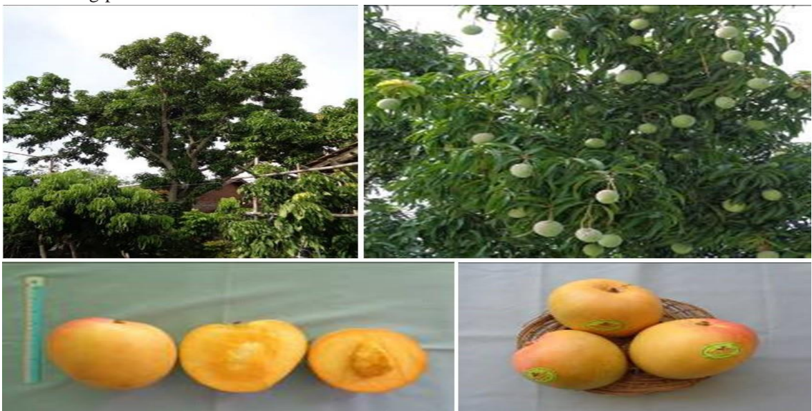
Gambar 2. Keragaan tanaman mangga Agrimania berumur 27 tahun dan buah mangga Agrimania. Sumber: Balai Penelitian Buah Tropika (2018).

Deskripsi mangga Agrimania berdasarkan karakter kuantitatif buahnya adalah sebagai berikut: bobot buah 771–1.400 g, panjang buah 11,20–17,60 cm, lebar buah 10,70–17,00 cm, tebal buah 10,20–15,96 cm, tebal daging buah 3,37–4,50 cm, TSS 15–17° Brix, total asam 0,59– 0,78%, vitamin C 9,68–15,39 mg/100 g, kadar air 82,47–82,50%, porsi buah yang bisa dimakan 80,09–83,52%, jumlah buah per malai 1–6 buah, jumlah buah per tanaman 375–415 buah dengan produksi 450–600 kg/ph/th