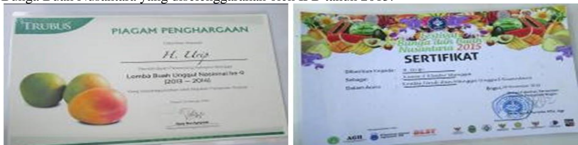
Gambar 3. Piagam penghargaan Mangga Agrimania sebagai Juara I Lomba Buah Unggul Nasional ke-IX Tahun 2014 (kiri) dan Juara III Festival Bunga dan Buah Nusantara di IPB Tahun 2015 (kanan).

Mangga Agrimania menjuarai perlombaan bidang hortikultura khususnya buah-buahan tingkat Nasional. Juara 1 Lomba Buah Unggul Nasional (LBUN) Ke-IX oleh Trubus dan Ditjen Hortikultura Kementerian Pertanian Republik Indonesia tahun 2013 dan 2014, dan juara 3 Festival Bunga Buah Nusantara yang diselenggarakan oleh IPB tahun 2015.